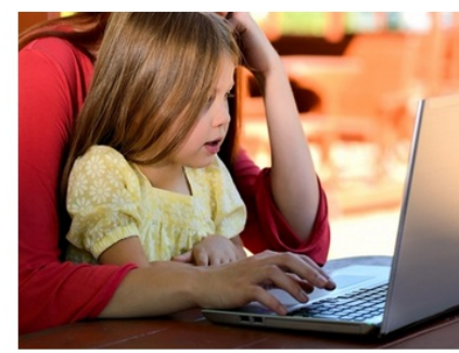
Werkplek Quick Scan