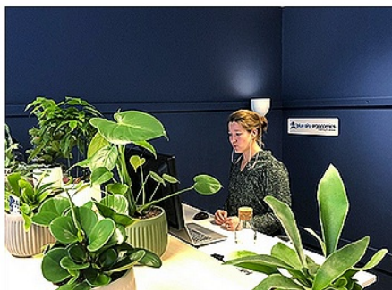
Fit op & aan het werk